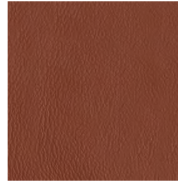
PR26 Cotto | Burnt Clay | Orangé rouge | Terrakotta | Naranja quemado | Терракота