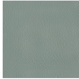
PR06 Verde chiaro | Light green | Vert clair | Hell grün | Verde claro | Светло-Зеленый