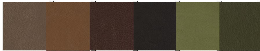
PR14 Fango | Mud | Vase | Schlamm | Barro | Серо-Бежевый