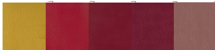
PR20 Giallo | Yellow | Jaune | Gelb | Amarillo | Желтый