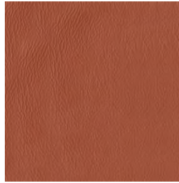
PR25 Mattone | Red Brick | Brique | Backstein | Ladrillo | Кирпичный